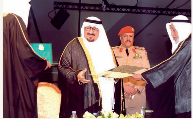
■ الحجّي - رحمه الله - متسلماً جائزة الملك فيصل لخدمة الإسلام

بدأ الحجّي مسيرته العملية في مطلع الأربعينيات، حيث مارس عدداً من الأعمال الحرة منذ عام 1942م، قبل أن ينتقل إلى العمل في القطاع الحكومي. ففي عام 1944م عُيّن في وزارة الصحة مسؤولاً عن مخازن الأدوية، وهو المنصب الذي ظل يشغله حتى عام 1960م، حيث عُرف خلال تلك الفترة بديقته في العمل وحسن إدارته للمهام الموكلة إليه.