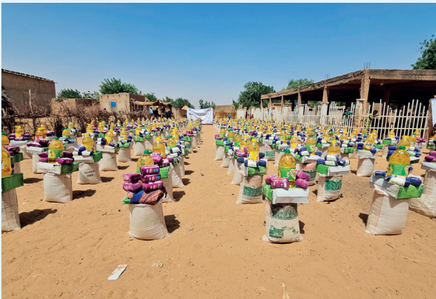
■ المشروع يصل إلى آلاف الأسر المتعففة حول العالم

ولفت إلى حرص الهيئة على الوصول إلى الفئات الأشد حاجة، وتعزيز حضور العمل الخيري الكويتي كرسالة إنسانية عالمية تقوم على الرحمة والمسؤولية.