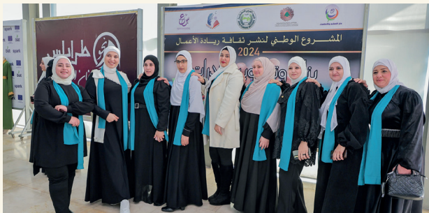
■ المستفيدات يبدعن في ابتكار تصاميم جديدة

من جهته، رحّب رئيس مجلس الإدارة بالوفد اللبناني، مثنًّا جهود جمعية الإرشاد في دعم رسالة العمل الخيري والإنساني.