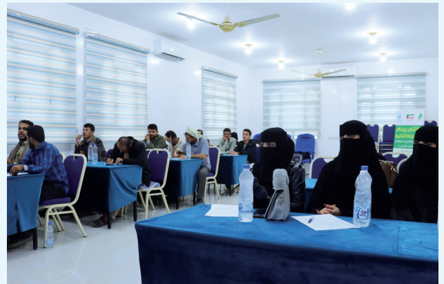
■ متدربون خلال إحدى الحصص التطبيقية ضمن برامج التدريب المهني

الاستثمار في الإنسان باعتباره الركيزة الأساسية لإعادة بناء المجتمعات وتعزيز قدرتها على التعافي