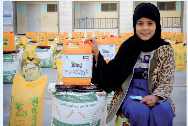
■ لحظة فرح من طفلة لدى تسلمها السلة الرمضانية

وفي الإطار نفسه، حرصت الهيئة الخيرية على رسم البسمة على وجوه الأسر المتعففة والعمال داخل الكويت، من خلال توزيع 8,750 وجبة إفطار و700 سلة غذائية، إلى جانب كسوة العيد لـ 364 مستفيدًا.