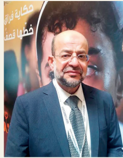
■ بقلم د. عصام يوسف رئيس الهيئة الشعبية العالمية لدعم غزة

في الثامن من مارس من كل عام يحتفل العالم باليوم العالمي للمرأة، حيث تستعرض النساء في مختلف البلدان ما تحققت من إنجازات في مجالات الحقوق والعمل والمشاركة في الحياة العامة.