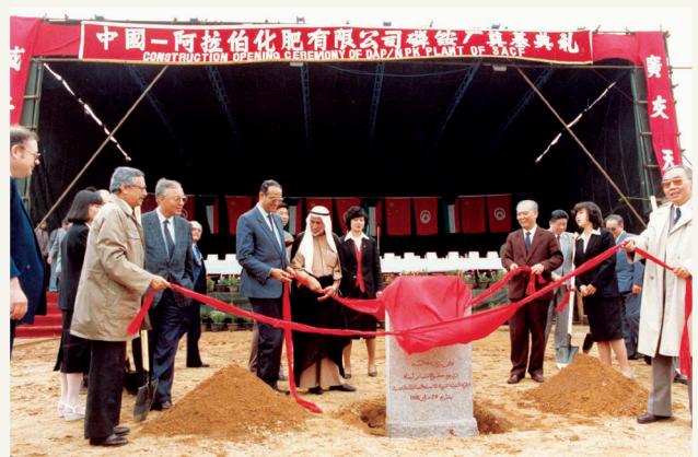
■ الحجّي مشاركاً في وضع حجر أساس أحد المشاريع

وفي مرحلة لاحقة من مسيرته، تولى الحجّي حقيبة وزارة الأوقاف والشؤون الإسلامية في الفترة من عام 1976م حتى عام 1984م، حيث شهدت تلك المرحلة