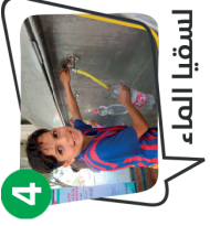
4 لسقيا الماء