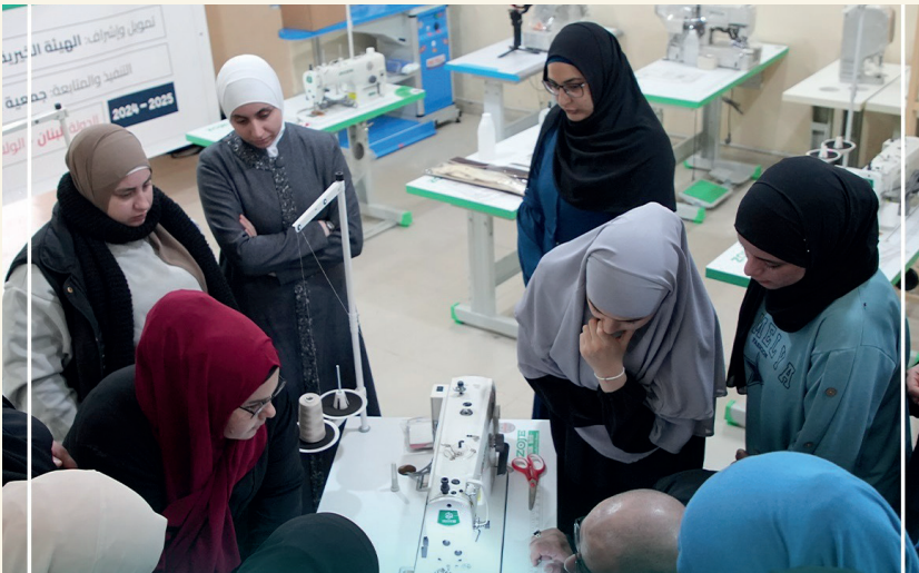
■ ورشة تدريب جماعية على فنون التفصيل والخياطة

في ظل واحدة من أشد الأزمات الاقتصادية والاجتماعية التي شهدها لبنان منذ عقود، تتصدر المبادرات التنموية المستدامة بوصفها خياراً إنسانياً ضرورياً يتجاوز حدود الإغاثة المؤقتة، متجهة نحو بناء القدرة على الصمود وتعزيز الاكتفاء الذاتي لدى الفئات الأكثر تأثراً بالأزمة.