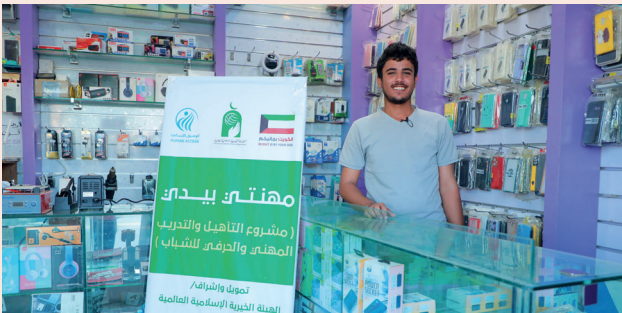
■ مشروع لبيع مستلزمات الهواتف من ريع وقفية الأسر المتعففة

إنه عطاءً يزرع الخير في كل أرض، ويجعل من كل قصة إنسانية حكاية أمل جديدة.. وأثرًا يبقى ما بقيت الحياة.