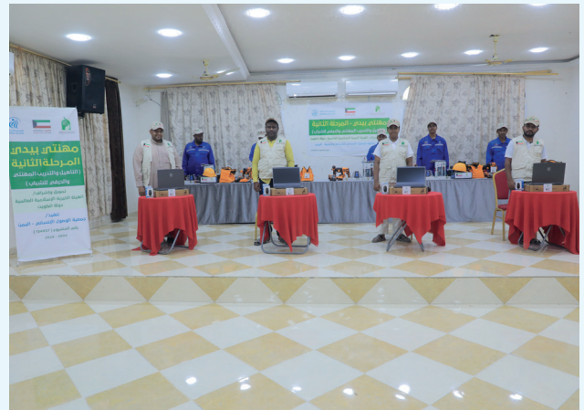
■ المشروع يوفّر للشباب فرصًا لاكتساب مهارات عملية

كما يشتمل المشروع على مجموعة من الأنشطة المصاحبة التي تهدف إلى تنمية المهارات الشخصية والمهنية لدى المتدربين، وتعزيز وعيهم المجتمعي