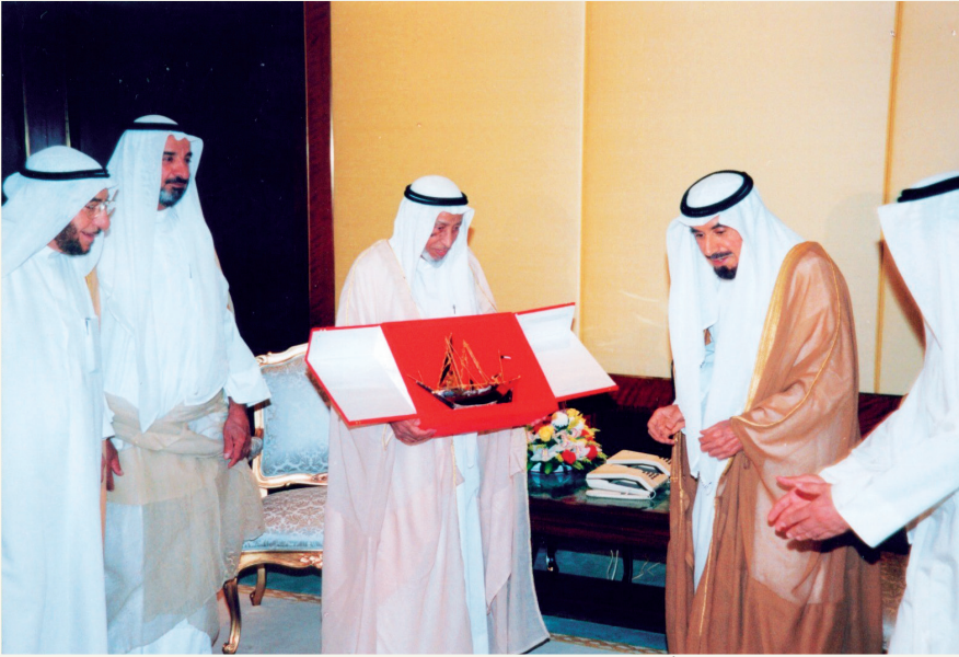
■ الشيخ جابر الأحمد مستقبلاً الحجّي وقيادات الهيئة الخيرية

في التاسع والعشرين من مارس 2020م، الموافق الخامس من شهر شعبان 1441هـ، فقد العالم الإسلامي أحد أبرز أعلام العمل الخيري والإنساني، العم يوسف جاسم الحجّي، المعروف بـ «أبي يعقوب»، الذي انتقل إلى جوار ربه عن عمر ناهز سبعة وتسعين عاماً، بعد حياة حافلة بالعبء والبذل، تاركاً وراءه إرثاً إنسانياً عميقاً وزاخراً في ميادين الخير والإحسان.