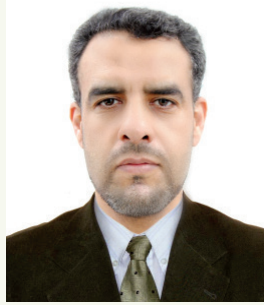
■ بقلم: د. بن يحيى بن عيسى

وفي الختام، يبقى الإنسان الحقيقي هو من جعل الخير منهجاً لحياته، وسعى في خدمة الناس ابتغاء مرضاة الله لا طلباً لمدح أو شهرة. ومن كان هذا طريقه، فليبشر برحمة الله وفضله، وحياة يملؤها الخير والسكينة في الدنيا، وجزاء كريم في الآخرة؛ إذ إن الساعي في قضاء حوائج الناس، والمبادر إلى نصرتهم وإغاثتهم، إنما يسلك طريق الإحسان الذي وعد الله أهله بالجزاء العظيم في الدنيا والآخرة.