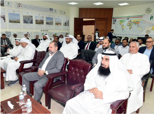
■ جانب من حضور قيادات وموظفي الهيئة حفل تبادل التهاني