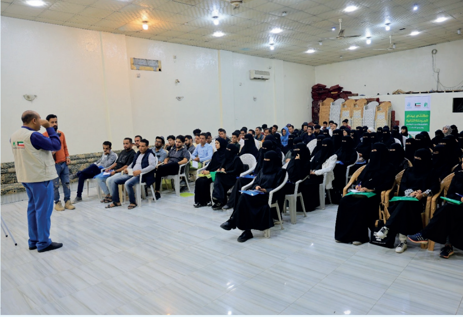
■ شباب يمنيون يتلقون تدريباً عملياً يفتح أمامهم آفاق العمل والإنتاج

في ظل الأزمات الممتدة التي يعيشها اليمن منذ سنوات، بات تمكين الشباب اقتصادياً ضرورة ملحة لتعزيز الاستقرار الاجتماعي والحد من تداعيات الفقر والبطالة. فالشباب يشكلون الشريحة الأوسع في المجتمع، كما يمثلون طاقة بشرية قادرة على الإسهام في إعادة بناء الاقتصاد المحلي إذا ما أتاحت لهم فرص التأهيل والتدريب والعمل.