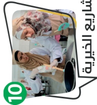
10 للمشاريع الخيرية والإنتاجية