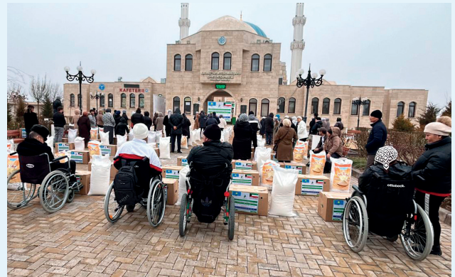
■ رمضان.. نفحات خير تعكس روح التكافل والتراحم بين المسلمين

لعوائد الأوقاف المباركة أثر كبير في إقامة الموائد الرمضانية وتفتير الصائمين»