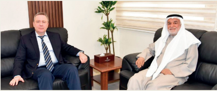
■ النوري مستقبلاً السفير الروسي فلاديمير جيلتوف