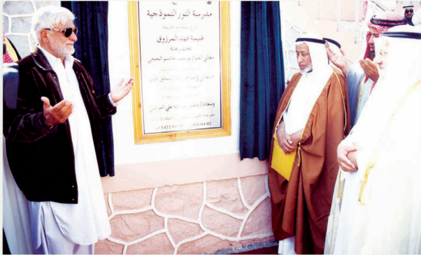
■ الحجى مفتتحًا مدرسة النور النموذجية في باكستان

وهكذا رحل أبو يعقوب جسّدًا، لكنه ترك وراءه مدرسة إنسانية في العطاء، وسيرة عطرة ستبقى شاهدًا على حياة كتبت صفحاتها بمداد الإحسان والعمل الصالح، نسأل الله تعالى أن يتغمده بواسع رحمته ومغفرته ورضوانه ويسكنه فسيح جناته.