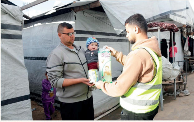
■ حلب حليب ومستلزمات صحية لدعم الأطفال المتضررين

ووقّر المشروع حلب حليب وحفاضات للأطفال لتلبية احتياجاتهم الغذائية الأساسية والمساهمة في الحفاظ على صحتهم والحد من الأمراض المرتبطة ببيئات الإيواء المكتظة. وقد بلغت تكلفة المشروع نحو 48039 دولاراً أميركياً، وجاء تنفيذه استناداً إلى دراسة ميدانية رصدت حجم الاحتياج المتزايد بين الأطفال باعتبارهم الفئة الأكثر هشاشة وتأثراً بالأزمات.