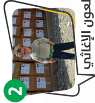
2 للعبء الإغاثي