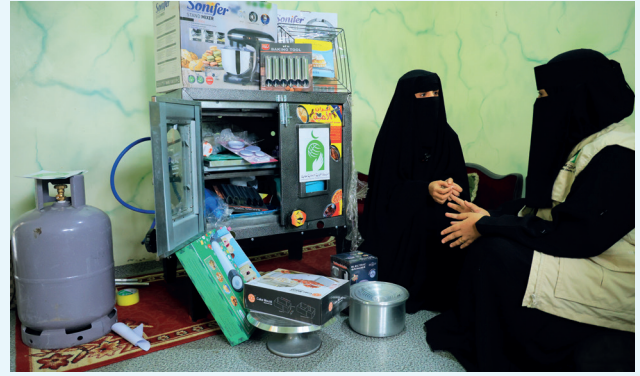
■ خطوة نحو إطلاق مشاريع صغيرة مدرة للدخل

ويستهدف المشروع الشباب اليمني من الجنسين عبر تزويدهم بمهارات مهنية وعملية متخصصة في مجالات إنتاجية وخدمية متنوعة، بما يعزز قدرتهم على الاندماج في سوق العمل المحلي ويفتح أمامهم آفاقًا حقيقية للاعتماد على الذات وإطلاق مشاريع صغيرة مدرة للدخل.