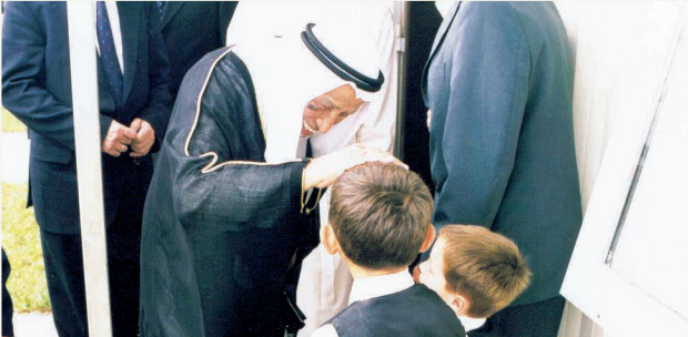
■ الحجّي ولمسة حانية على رأس أحد الاطفال في إحدى جولاته الخيرية

لقد كان يسعى من خلال عطائه إلى سد كل ثغرات الضعف والوهن في الجسد الإسلامي، والارتقاء بالضعفاء والمتضررين من أبناء المسلمين إلى مستوى إنساني كريم، يعيد دمجهم في مجتمعات العمل والإنتاج، ويمنحهم فرصة العيش بكرامة واعتزاز.