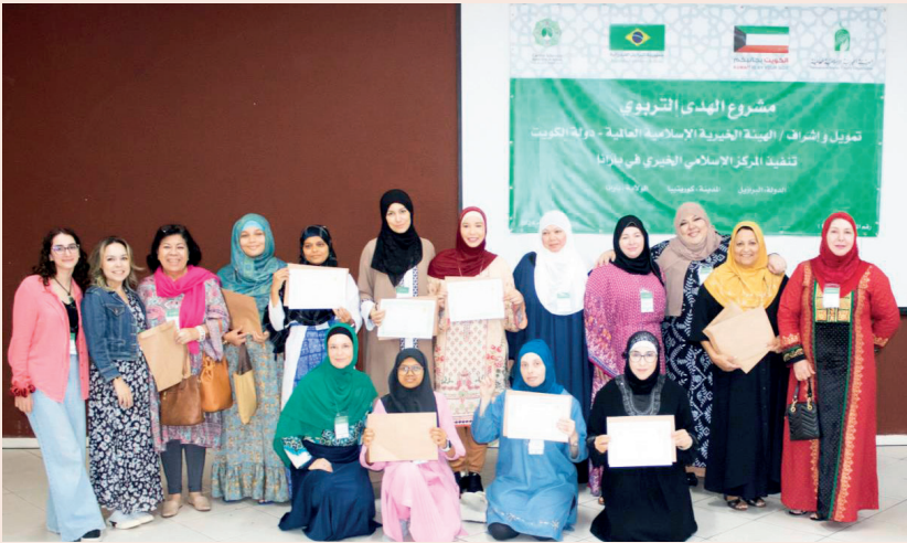
■ برنامج لتعليم المسلمين الجدد أحكام الدين الإسلامي

في عالم تتكاثر فيه الأزمات وتتقلص فيه الفرص أمام ملايين البشر، يظل الوقف أحد أكثر الأدوات الإنسانية قدرة على إحداث تغيير حقيقي ومستدام في حياة الناس، فهو ليس مجرد فعل إحسان عابر، بل منظومة عطاء طويلة الأمد تستثمر في الإنسان، وتعيد بناء قدرته على الإنتاج والاستقرار والعيش الكريم.