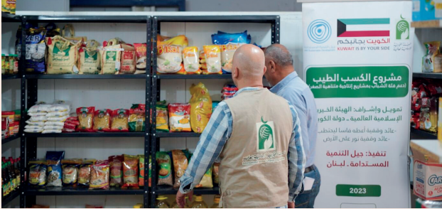
■ منفذ لبيع المواد الغذائية من عائدة وقفية نور على الأرض

ومع الوقت، بدأ المشروع يحقق نجاحًا ملحوظًا، حيث أصبح يقدم خدمات تركيب وصيانة أنظمة الطاقة الشمسية في منطقته، محققًا مصدر دخل مستقر لأسرته.