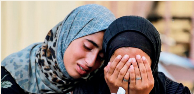
■ فلسطينيات غزة يعشن واقعاً مأساوياً

من بين أكثر القضايا الإنسانية إيلاًماً في غزة قضية المفقودين تحت الأنقاض، لا تزال آلاف العائلات تنتظر معرفة مصير أحيائها، إذ تشير التقديرات الميدانية إلى أن عدد المفقودين في القطاع يبلغ نحو ثمانية آلاف شخص، بينهم ما لا يقل عن 3200 امرأة وفتاة. وتذهب تقديرات أخرى إلى أن النساء قد يشكلن نحو 70% من إجمالي المفقودين، في ظل غياب إحصاءات دقيقة بسبب الدمار الهائل وصعوبة الوصول إلى مواقع الأنقاض.