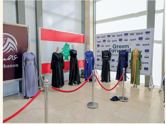
■ منتجات المشاركات تعكس مستوى التدريب وجودة المهارات المكتسبة