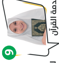
9 لخدمة القرآن والمراكز الدعوية