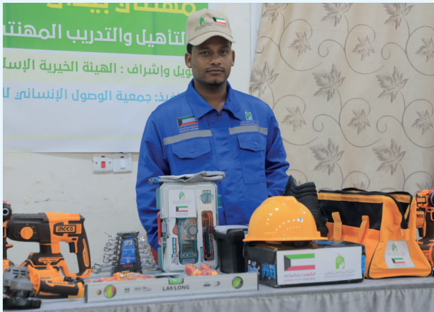
■ مشروع «مهنتي بيدي» يفتح مسارات جديدة أمام الشباب

ومن هنا تبرز أهمية المبادرات التنموية التي تستهدف الشباب ببرامج تدريبية ومشاريع صغيرة مدرة للدخل، تساهم في تمكينهم اقتصاديًا ودمجهم في النشاط الاقتصادي، بما يحقق الاستقرار الاجتماعي ويحد من مظاهر الفقر والهشاشة الاقتصادية.