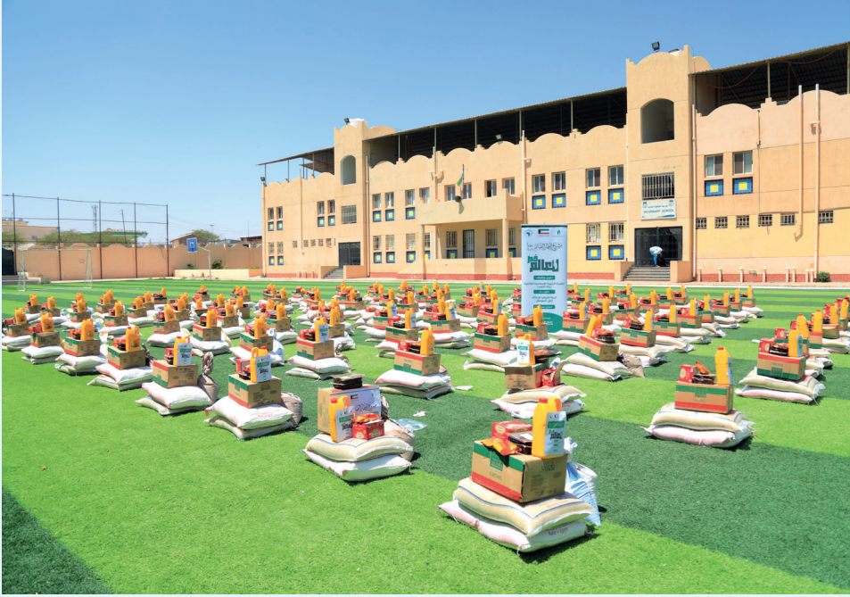
■ سلال رمضان لتلبية احتياجات الصائمين

رغم التحديات الراهنة التي تشهدها المنطقة، حقق مشروع «إفطار الصائم» الذي أطلقته الهيئة الخيرية لعام 2026م أثراً واسعاً امتد إلى 17 دولة، ليصل خيره إلى الفئات الأكثر حاجة داخل الكويت وخارجها