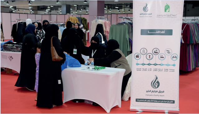
■ فريق فرائم يشغل في توزيع ملابس العيد

بالتعاون مع الهيئة الخيرية، نظمت الجمعية الكويتية للأسر المتعففة معرض «كسوة رمضان والعيد» على مدى ثلاثة أيام، خلال الفترة من 20 إلى 22 فبراير في أرض المعارض، ضمن برامجها الموسمية الرمضانية، وبمشاركة عدد من الجهات الداعمة والمؤسسات المجتمعية.