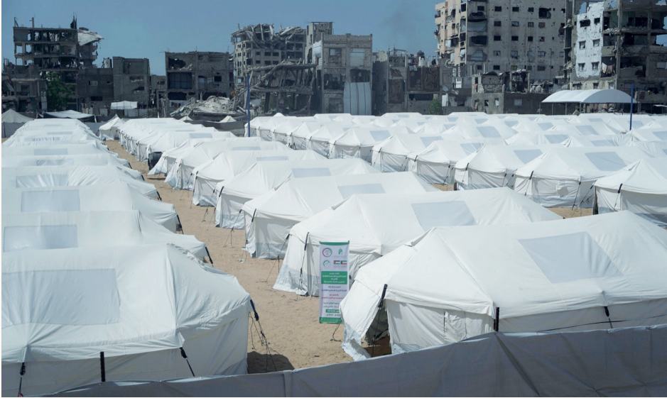
■ مخيمات إيواء توفر مأوى مؤقتاً للأسر التي فقدت منازلها بسبب الحرب

في وقت تتفاقم فيه الأزمة الإنسانية في قطاع غزة جراء العدوان المتواصل وما خلفه من دمار واسع ونزوح جماعي ونقص حاد في الغذاء والدواء والمأوى، تتواصل الجهود الإنسانية للهيئة الخيرية الإسلامية العالمية لإسناد السكان وتخفيف معاناتهم اليومية.