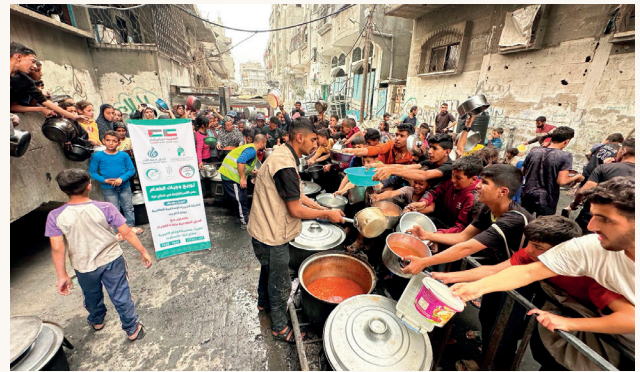
■ تكايا الطعام تسهم في تأمين وجبات يومية للأسر النازحة في مراكز الإيواء

وشمل المشروع تنفيذ 30 تكية طعام بواقع تكية يومية على مدار شهر كامل، حيث تتضمن كل تكية إعداد 14 قدراً من الطعام بإجمالي 420 قدراً خلال فترة التنفيذ. ويكفي القدر الواحد لإطعام نحو 200 شخص بحسب نوعية الوجبة، ما يوفر قرابة 2800 وجبة يومية، ويصل إجمالي المستفيدين إلى نحو 84 ألف شخص طوال مدة المشروع.