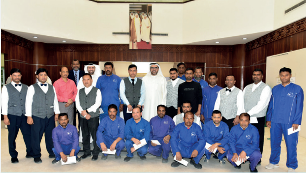
■ المدير العام يتوسط عمال الهيئة في لحظة تذكارية بعد توزيع «العيادي»

في أجواء مفعمة بالمودة والتقدير، وحرصاً على إدخال السرور إلى قلوب العمال، قام المدير العام بتوزيع «العيادي» عليهم في أول يوم عمل بعد عطلة عيد الفطر المبارك، ما يعكس روح الأخوة والتكافل داخل الهيئة الخيرية.