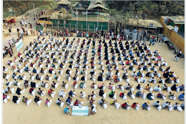
■ مشروع إفطار الصائم ينشر الأمل والبهجة بين الصائمين

وتُعد الشراكة في رؤية الهيئة أحد أهم عوامل نجاح أي مشروع خيري، لما لها من دور كبير في تعظيم الموارد وتبادل الخبرات وتسريع عملية التنفيذ، وإيصال الدعم إلى المستفيدين بكفاءة وفعالية.