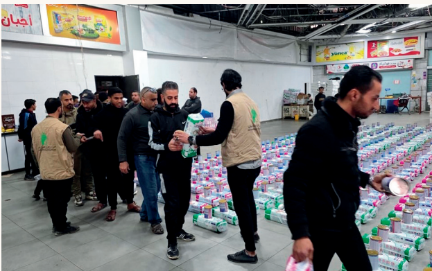
■ توزيع مساعدات غذائية وصحية للأطفال في مراكز الإيواء

ويأتي تنفيذ هذه المشاريع امتداداً للدور الإنساني الذي تضطلع به دولة الكويت ومؤسساتها الخيرية في إغاثة المتضررين حول العالم، وترسيخ ثقافة العطاء والعمل الإنساني المستدام.