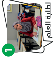
1 لطلبة العلم