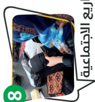
8 للمشاريع الاجتماعية

سهـم يضاء ف أجركـم .. ويصرف منه كل عام على 10 مشاريع متنوعة