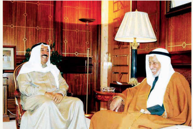
■ الحجّي مع الأمير الراحل الشيخ صباح الأحمد - رحمهما الله

الراحل قاد الهيئة الخيرية مدة ربع قرن مع قراءة 160 شخصية من العلماء والمفكرين ورجال الخير في العالم الإسلامي "