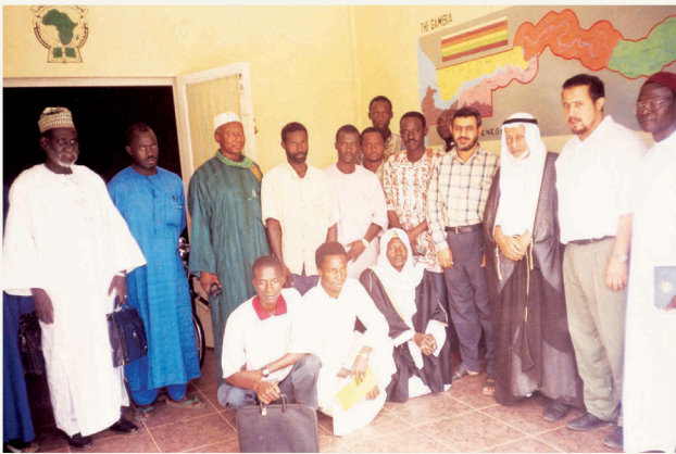
■ جانب من إحدى جولاته الإفريقية

وترجع فكرة إنشاء هذه المؤسسة العريقة إلى مؤتمر المصارف الإسلامية الذي انعقد في الكويت في 17 يونيو 1984م، حيث طُرحت آنذاك مبادرة طموحة لتأسيس هيئة خيرية عالمية، جاءت ثمرة تحركات جادة وجهود مكثفة قامت بها نخبة من علماء الأمة ورجال الخير في الكويت وخارجها. وقد انطلقت تلك المبادرة من رؤية استراتيجية تهدف إلى إنشاء وقف خيري ضخم تُجمع له موارد تصل إلى مليار دولار، تُنفق عوائدها على برامج بناء الإنسان وتنمية قدراته في مختلف المجالات التعليمية والدعوية والتنمية.