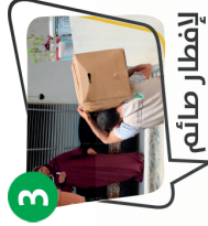
3 لإفطار صائم