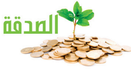
■ الصدقة تدفع البلاء

لقد أدركت الشريعة الإسلامية منذ قرون أهمية الإحسان إلى الخلق في دفع البلاء وتخفيف المصائب، فجعلت أعمال البر والإحسان سبباً في حفظ المجتمعات من كثير من الأفات. ومن هنا فإن العطاء لا يقتصر أثره على المستفيدين منه فحسب، بل يتجاوز ذلك ليصنع شبكة أمان اجتماعي تحمي المجتمع بأكمله من الانهيار أو التفكك، وتعزز روح التكاتف والتضامن بين أفراد.