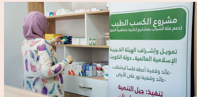
■ مشروع صيدلية من عائد وقفية أعطت فأساً ليحتطب

ومع مرور الوقت، تحوّلت موهبتها إلى مشروع إنتاجي حقيقي؛ إذ أنشأت ورشة صغيرة للرسم على الزجاج والهدايا الفنية، وأصبح عملها يدرّ دخلاً ثابتاً يساهم في إعالة أسرتها ويمنحها استقلالاً اقتصادياً طالما حلمت به.