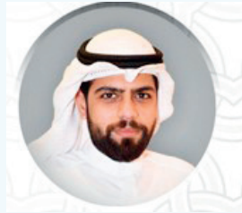
■ بقلم جراح الزايد

ومن بناء المساجد والمستشفيات وحضر الأبار، إلى تأسيس المدارس وورش التدريب المهني، أثبتت الهيئة قدرتها على تحويل أصل الوقف إلى دورة اقتصادية وتنموية مستدامة، تُحیی المجتمعات الفقيرة وتحقق شرط الواقف في نفع الخلق ودوام الأجر.