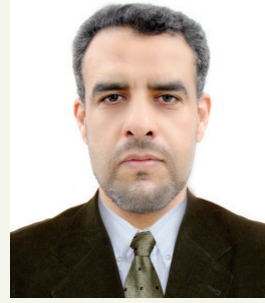
■ بقلم: د. د. يحيى بن عيسى محدادي باحث في الدراسات الإنسانية

يحلُّ شهرُ رمضانَ حاملاً معه أجواءَ إيمانيةً خاصة، تتجلى فيها قيم الرحمة والتكافل، وتسمو خلالها معاني الإحسان في النفوس؛ إذ يستقبله المسلمون بشوقٍ عميق لما يمنحه من طمأنينة روحية، وفرصٍ متجددة لمراجعة الذات وتعزيز الصلة بالله، فضلاً عما يتيح من مساحة إنسانية واسعة لفعل الخير وخدمة الآخرين، بما يجعل من حضوره حدثاً يتجاوز البعد الزمني ليغدو حالةً قيمية متكاملة.