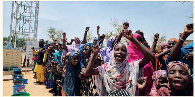
■ كفالة الطلاب تفتح آفاق الأمل أمام الأجيال الصاعدة

وأشارت إلى أن الشراكة المستدامة مع الداعمين تمثل حجر الزاوية في رحلتها الإنسانية، وتجسد قناعة راسخة بأن العمل الخيري مسؤولية جماعية، تتكامل فيها الجهود لإحداث أثر حقيقي، وتغيير حياة المستفيدين، وصون كرامتهم الإنسانية.