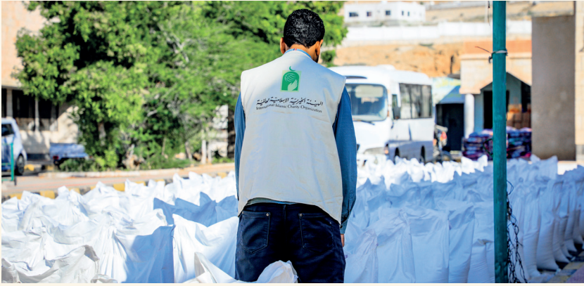
■ التكافل الاجتماعي حاضر في أوقات الشدة والازمات

رغم التحديات التنظيمية والإجرائية، واصلت الهيئة الخيرية الإسلامية العالمية في عام 2025 أداء رسالتها الإنسانية بروح مؤسسية عالية، مدركة أن ترسيخ قواعد الحوكمة والشفافية بشكل أساساً لاستدامة العمل الإنساني وتعظيم أثره على المدى الطويل.