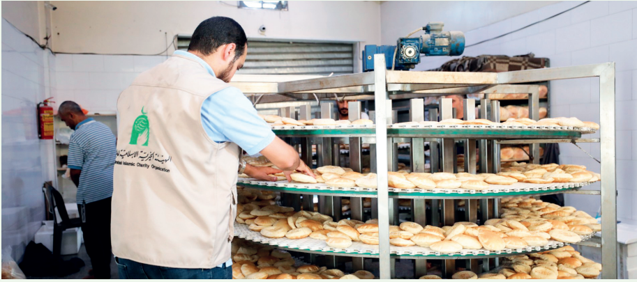
■ الهيئة الخيرية تواصل العمل على توفير الخبز لأهل غزة

في ظل واحدة من أقسى الأزمات الإنسانية التي يشهدها العالم في العصر الحديث، يعيش قطاع غزة منذ أكتوبر 2023 حالة غير مسبوقة من الانهيار الشامل في مقومات الحياة الأساسية، وفي مقدمتها الأمن الغذائي، نتيجة الحصار الكامل، وتدمير البنية التحتية، وإغلاق المعابر، وشح الوقود والمواد الأساسية، ما جعل الحصول على الغذاء تحدياً يومياً يهدد حياة السكان.