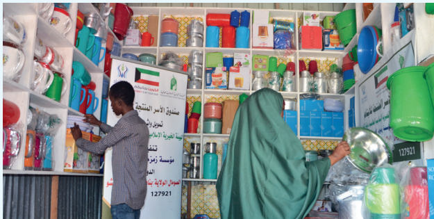
■ تمكين الأسر الصومالية وتحويل التحديات إلى فرص