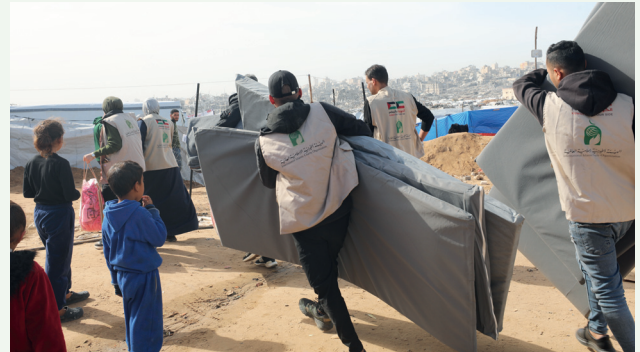
■ الفرق الميدانية أثناء توزيع مستلزمات الشتاء

استهدف المشروع ٥٠٠ أسرة من الأسر الأشد فقراً وحاجة، بما في ذلك الأسر التي عادت إلى شمال القطاع، أو تلك العالقة في جنوبه. وقد تم توفير حقيبة كسوة شتوية متكاملة لكل أسرة، تليي احتياجات جميع أفرادها من كبار وصغار، عبر آلية مرتبة تضمن كرامة المستفيدين، حيث مُنحت الأسر قسائم شرائية لاختيار الملابس المناسبة لأعمارهم واحتياجاتهم من معارض معتمدة، تحت إشراف لجان رقابية من الجمعية لضمان جودة الأصناف والالتزام بالأسعار المتفق عليها.