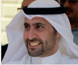
■ بقلم: إبراهيم البدر نائب المدير العام لقطاع المشاريع

وبهذه الروح، تظل الكويت نموذجاً يحتذى به في العمل الإنساني، حيث يصبح العطاء رسالة لا تنقطع، والإنسان محور كل جهد، والابتكار أداة لتعظيم الأثر، مما يجعل من مستقبل العمل الخيري الكويتي فرصة تاريخية لصناعة مجتمع أكثر عدلاً، وإنسانية، وأملًا.