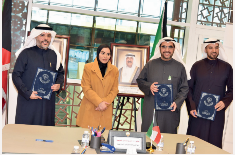
■ جانب من مراسم توقيع البروتوكول بحضور وزيرة الشؤون الاجتماعية