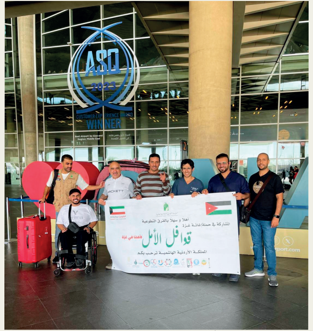
■ فريق الإرادة مشاركاً في قوافل الأمل

ومن هذا المنطلق، ندعو الجهات الداعمة والجمهور إلى النظر إليهم كشركاء فاعلين في التنمية، ومنحهم الفرص الكاملة للمشاركة والإبداع، بما يضمن اندماجهم الحقيقي ويسهم في بناء مجتمع أكثر عدالة وتماسكاً.