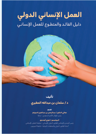
■ غلاف الكتاب

وعلى الرغم من المستوى العلمي والمنهجي الرفيع الذي يتسم به الكتاب، فإن بعض القراء من غير المتخصصين أكاديمياً قد يستفيدون من تعزيز المداخل التأسيسية المرتبطة بالقانون الدولي الإنساني، بما ييسر استيعاب المفاهيم القانونية ذات الطابع الفني، ويجعلها أكثر قرباً للقارئ العام.