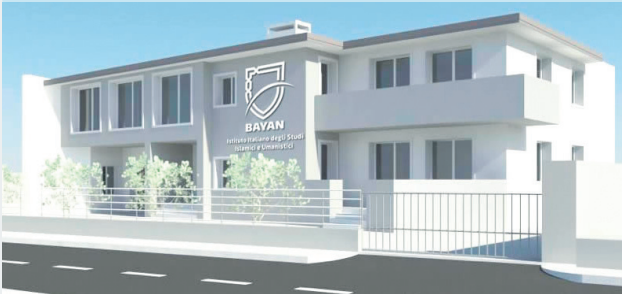
■ معهد بيان في إيطاليا

يقع معهد «بيان» في مدينة فيرونا التابعة لإقليم الفينيتو شمالي إيطاليا، على المحور الحيوي الرابط بين مدينتي البندقية وميلانو، وهو من أكثر الأقاليم الإيطالية كثافةً للجاليات المسلمة. ويأتي اختيار موقع المعهد في قلب هذا الحيز الجغرافي النشط استجابةً واعيةً لحاجات تعليمية ودعوية متزايدة.