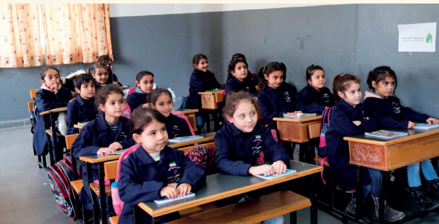
■ كفالات تعليمية تصنع مسار حياة جديداً

واصلت الهيئة دعمها للفئات الأشد حاجة، بتنفيذ 15.109 كفالات شملت 6.390 يتيماً و8.719 طالب علم في 25 دولة، تجسيداً عملياً لرؤيتها في رعاية الإنسان علمياً ونفسياً واجتماعياً.