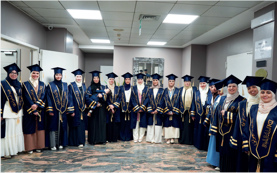
■ جانب من خريجات معهد بيان وهن يتوجن مسيرتهن العلمية بحصولهن على درجة البكالوريوس

بدعم وتمويل من الهيئة الخيرية الإسلامية العالمية، احتفى المعهد الإيطالي للدراسات الإسلامية والإنسانية «بيان» بتخريج الدفعة الأولى من حملة درجة البكالوريوس في الدراسات الشرعية، ضمن شراكة مؤسسية مع الجمعية الإسلامية الإيطالية للأئمة والمرشدين، تجسيداً لرؤية علمية وإنسانية تهدف إلى إعداد كوادر مؤهلة تجمع بين الأصالة المعرفية والانفتاح الحضاري.