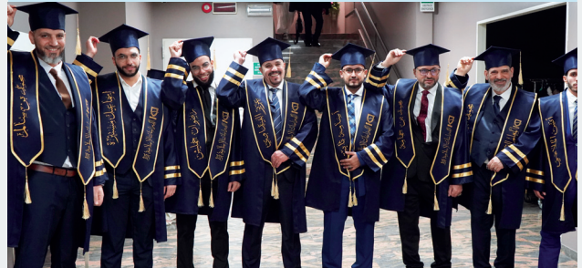
■ خريجو معهد بيان يحصدون ثمرة الاجتهاد والمناجزة

يستهدف معهد «بيان» أبناء المسلمين في إيطاليا وأوروبا، إضافة إلى الباحثين والمهتمين بالعلوم الإسلامية والإنسانية، من خلال برامج أكاديمية متخصصة تجمع بين التواصل العلمي والانفتاح الثقافي بما يتلاءم مع السياق الأوروبي.