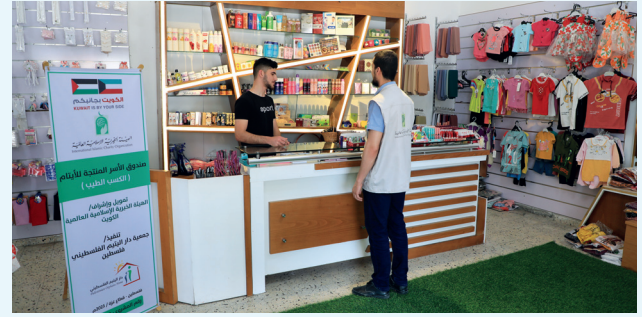
■ مشاريع إنتاجية توفر دخلاً ثابتاً للأسر الفلسطينية

وبذلك، يجسد «صندوق الأسر المنتجة للأيتام» نقلة نوعية في مسار رعاية الأيتام، ويعكس رؤية الهيئة الخيرية الإسلامية العالمية في صناعة الإنسان المنتج، القادر على الاعتماد على نفسه، وتحويل التحديات إلى فرص، والعمل الخيري إلى تنمية مستدامة.