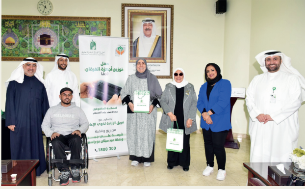
■ من أنشطة فريق الإدارة التطوعي

ويجري اختيار هؤلاء بعناية، بما يضمن قدرتهم على دعم الأشخاص ذوي الإعاقة والمساهمة الفاعلة في كسر الحواجز المجتمعية.