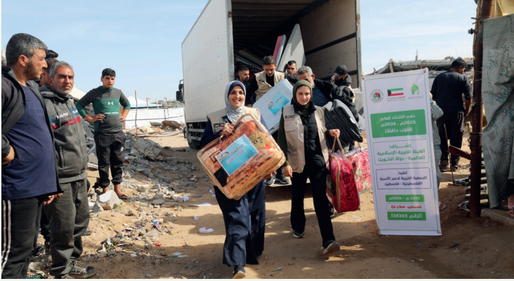
■ المشروع استهدف الأسر النازحة في المخيمات

في ظل واحد من أقسى فصول الشتاء التي تمر على قطاع غزة، نفذت الهيئة الخيرية مشروعها الإنساني «شتاء دافئ»؛ استجابة لحالة إنسانية غير مسبوقه يعيشها مئات الآلاف من النازحين الذين وجدوا أنفسهم في مواجهة مباشرة مع البرد القارس والأمطار الغزيرة، داخل خيام ومراكز إيواء تفتقر إلى أبسط مقومات الحياة الكريمة، وذلك بالشراكة مع الجمعية الخيرية لدعم الأسرة الفلسطينية.