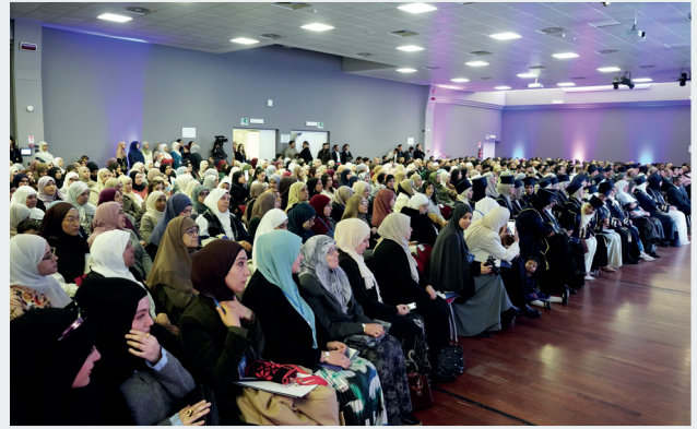
■ مشاركة واسعة من النخب الإسلامية في إيطاليا وأولياء أمور الخريجين