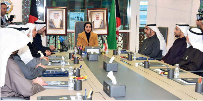
■ قيادات وزارة الشؤون والهيئة الخيرية و«نماء الخيرية» خلال مراسم التوقيع

في إطار تعزيز التكامل المؤسسي وتوحيد الجهود، وقعت الهيئة الخيرية الإسلامية العالمية ووزارة الشؤون الاجتماعية وجمعية نماء الخيرية بروتوكول تعاون مشترك يهدف إلى إعادة تأهيل وصيانة المباني المخصصة لدور الرعاية الاجتماعية، بما يضمن جاهزيتها التشغيلية وتهيئة بيئة علاجية إنسانية وأمنة تساهم في دعم مسارات التعافي وتقديم الرعاية المتكاملة.