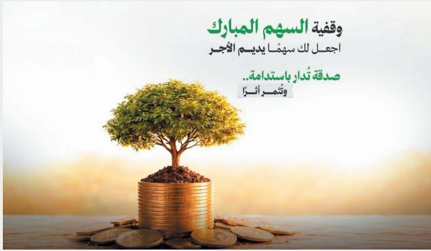
■ وقفية السهم المبارك

يُعدُّ الوقف الخيري من أعظم أبواب الصدقة الجارية، لما يتيح له من تمكين واستدامة للنفع، واستمرار للأجر والثواب للواقفين، ويُمثل دعامة أساسية لدعم المشاريع الخيرية والتنمية على المدى الطويل.