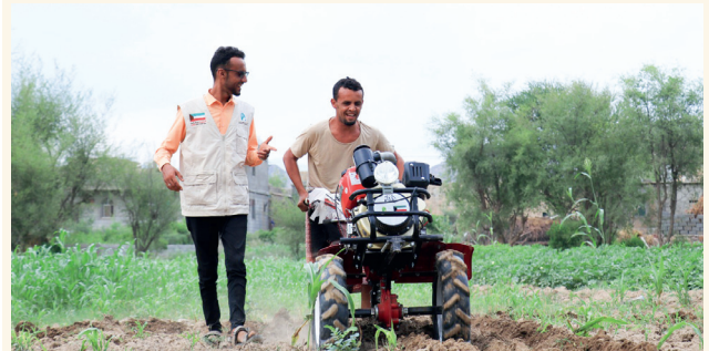
■ مشاريع تنموية تعزز الاعتماد على الذات وتفتح أبواب الرزق الكريم