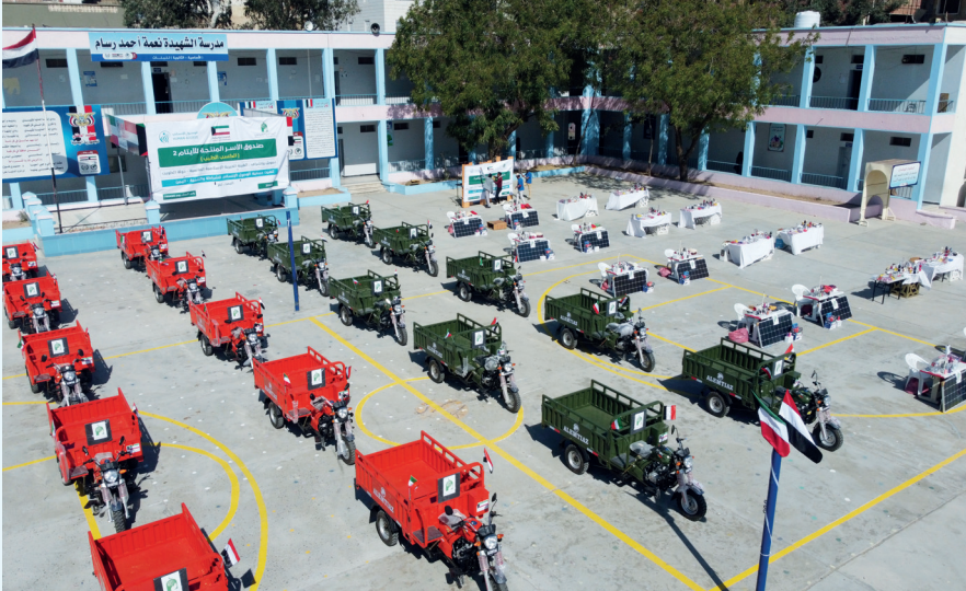
■ آلات نقل للتوزيع على الأسر اليمينية المتعقبة

في تحول نوعي يعكس نضج العمل الخيري وتطوره نحو الاستدامة، تواصل الهيئة الخيرية الإسلامية العالمية ترسيخ نموذج متقدم في رعاية الأيتام، يتجاوز مفهوم الكفالة التقليدية ليصل إلى التمكين الاقتصادي والاجتماعي.