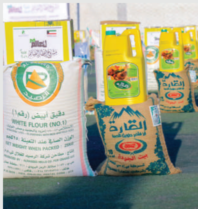
تقرير مشروع إفطار الصائم | 2026م