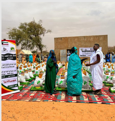
تقرير مشروع إفطار الصائم | 1444هـ - 2023م